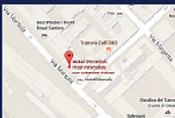
Hotel Stromboli Via Marsala, 34 I - 00185 Roma