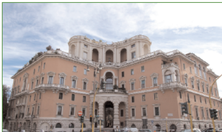
Roma. La sede dell'Ordine dei dottori commercialisti ed esperti contabili

R. Qualsiasi fusione porta suscita reazioni e critiche, ma essa ci ha offerto l'opportunità di rappresentare le nostre categorie all'esterno in modo unitario. I problemi di carattere tecnico esulano dal nostro Albo e riguardano principalmente la gestione delle Casse di previdenza, ossia la Cassa dei dottori commercialisti e la Cassa dei ragionieri, che abbiamo ritenuto di affidare ai nostri rappresentanti istituzionali. Si presentano spesso problemi di carattere politico, cosicché in un «gentlemen agreement» abbiamo stabilito che essi vadano risolti